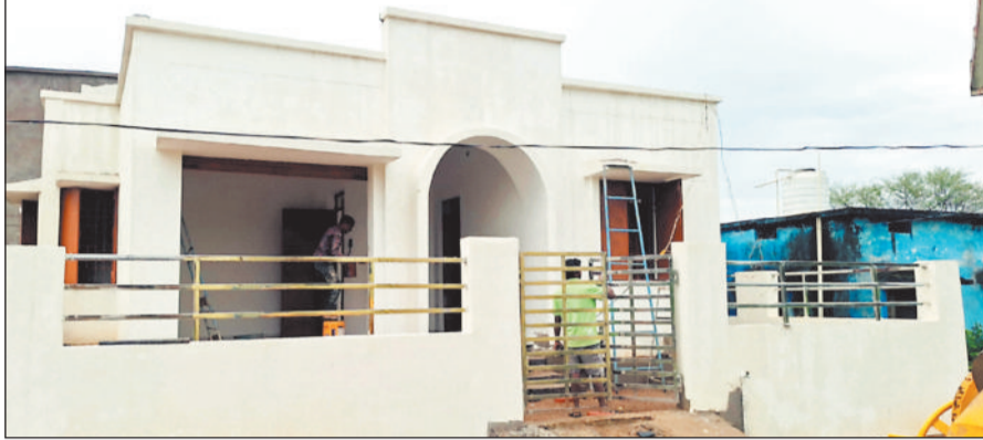
महतारी सदन की विशेषताएँ

कुल 4 करोड़ 42 लाख रुपये की लागत से बन रहे इन महतारी सदन पर प्रति भवन लगभग 29 लाख 50 हजार रुपये का खर्च आ रहा है। प्रत्येक भवन को करीब 2500 वर्गफुट क्षेत्र में आधुनिक सुविधाओं के साथ तैयार किया जा रहा है। इन भवनों में बैठक हॉल, प्रशिक्षण कक्ष, पेयजल, शौचालय और अन्य बुनियादी सुविधाएँ उपलब्ध होंगी। प्रदेश के मुख्यमंत्री विष्णुदेव साय आगामी दिनों में रायगढ़ जिले में तैयार हो चुके